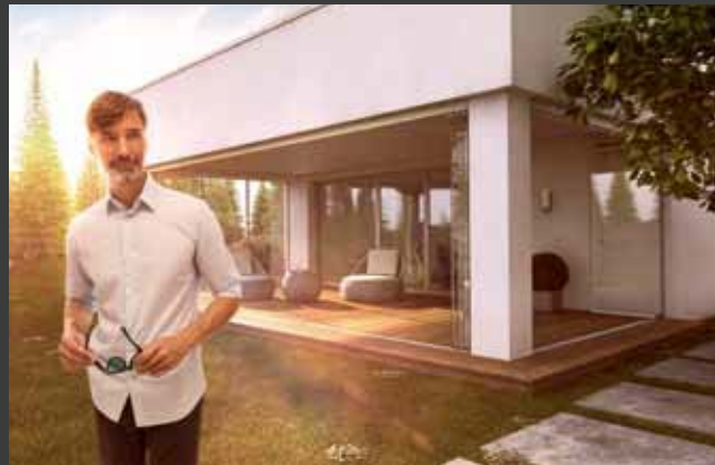
Schuif-/draaisystemen Systèmes coulissants-pivotants