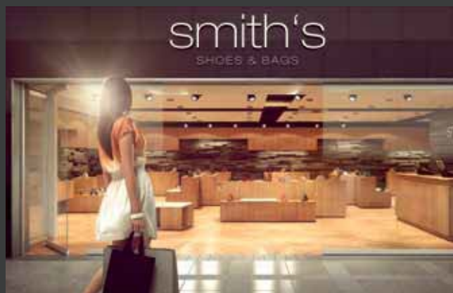
Horizontale schuifwanden Systèmes de parois coulissantes horizontales