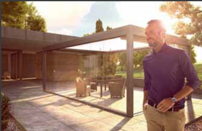
Schuifsystemen Systèmes coulissants